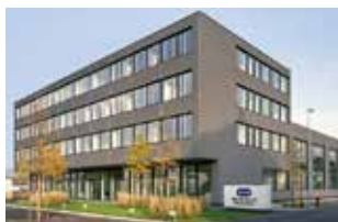
Headquarters of the WAB-GROUP

Junkermattstrasse 11 P.O. Box 944 4132 Muttenz 1 Switzerland Tel. +41 61 6867-100 Fax +41 61 6867-110 wab@wab-group.com www.wab-group.com