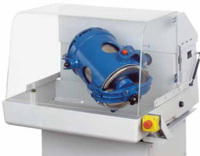
TURBULA® T 10 B