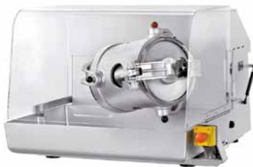
TURBULA® T10B in Sonderlackierung TURBULA® T10B with special coating TURBULA® T10B avec peinture spéciale