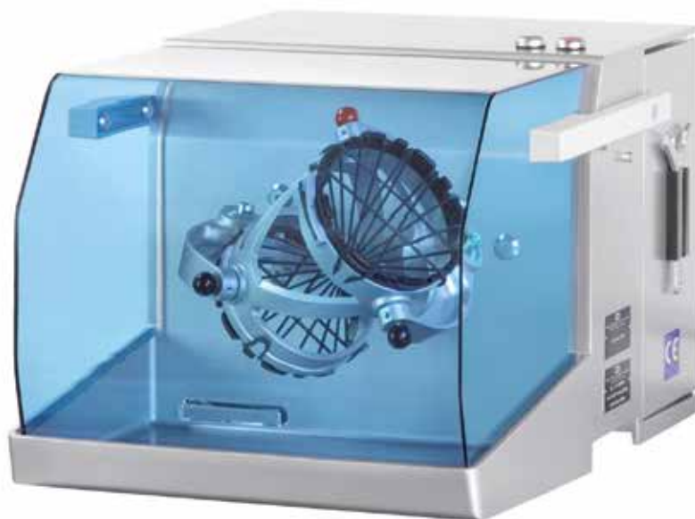
TURBULA® T2F mit FU, in Sonderlackierung TURBULA® T2F with FC, with special coating TURBULA® T2F avec CF, avec peinture spéciale

Le mélangeur TURBULA® T 2 F est utilisé dans toutes les industries et domaines, particulièrement en recherche, développement et analyse.