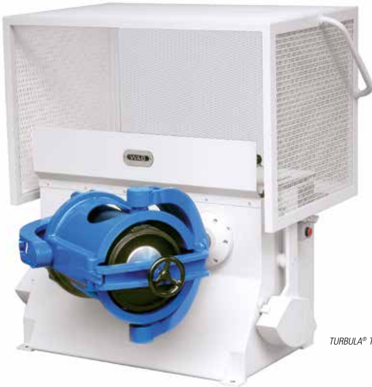
TURBULA® T 50 A