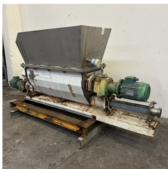
Pompe à vis excentrée PCM MV151BB10 S/S Eccentric screw pump