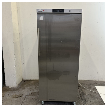
Congélateur ventilé LIEBHERR 325 litres S/S ventilated freezer