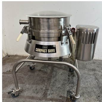
Tamis vibrant RUSSEL FINEX COMPACT SIEVE type 17240 S/S sieve