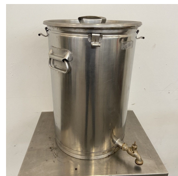
33 cuves inox 50 litres S/S tanks