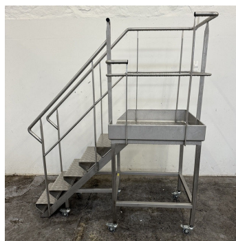
Plateforme mobile avec escalier Mobile platform