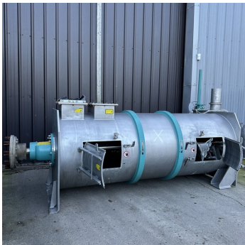
Mélangeur continu à socs LÓDIGE KM3000D inox S/S continuous ploughshare mixer