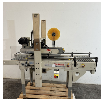
Scotcheuse automatique 3M modèle 77R Automatic case sealer