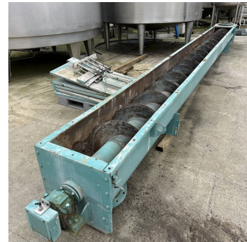
Vis acier Lg. 7900 mm Steel through screw conveyor