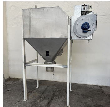
Dépoussiéreur inox 3m 2 FDI à poches S/S pocket dust collector