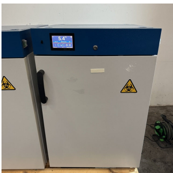
Incubateur réfrigéré VWR INCU-Line 150R Cooled incubator