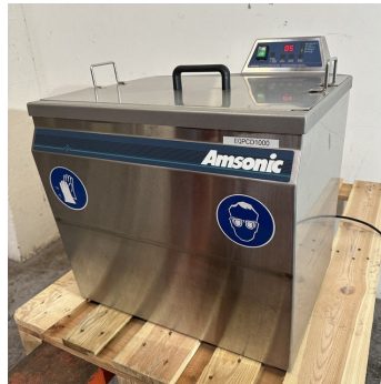
Cuve de nettoyage à ultrasons AMSONIC Ultrasonic cleaning tank